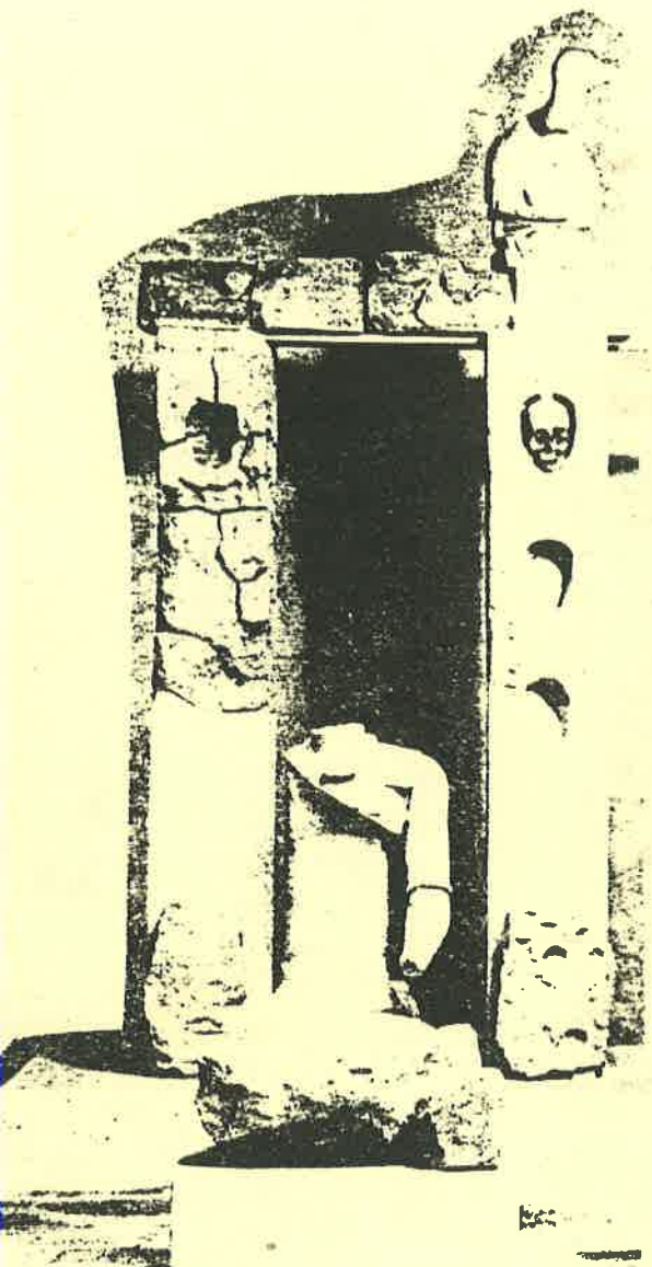
Vista parcial de un santuario celta mostrando pilares de piedra con calaveras humanas asomando en los nichos. Siglos III y II, B.C.